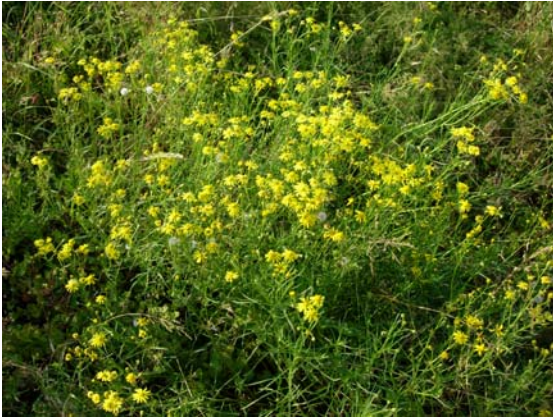
Bestand Senecio inaequidens , Autobahn Lausanne-Genf